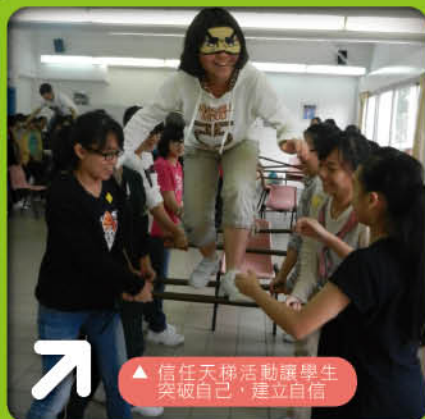
▲ 信任天梯活動讓學生突破自己，建立自信