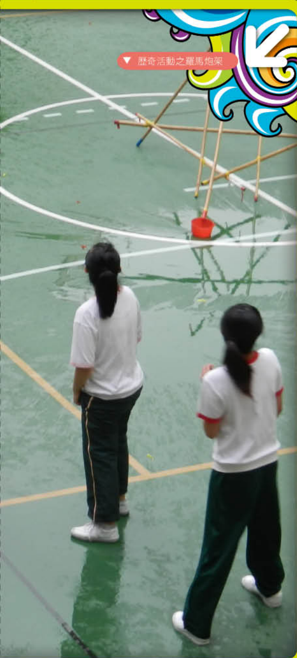
▼ 歷奇活動之羅馬炮架