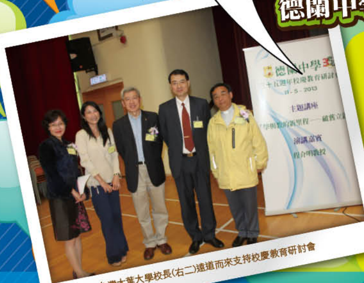
▲ 台灣大葉大學校長(右二)遠道而來支持校慶教育研討會

活動分兩部分：第一部分為主題演講，演講嘉賓為香港大學教育學院講座教授程介明教授。程教授指出社會不斷轉變，教育亦需作出相應改革。教授舉出多個例子，從不同角度闡述21世紀社會的急遽多變：學業不等於就業，人的一生會不斷地轉工、轉行，還有舊式工種消失，個體創業增加；新型的工作形態，需要頻密的人際交往。凡此種種，傳統冀盼考試成名、仰賴一技之長這些想法，均已無法適應一個後工業社會的要求。