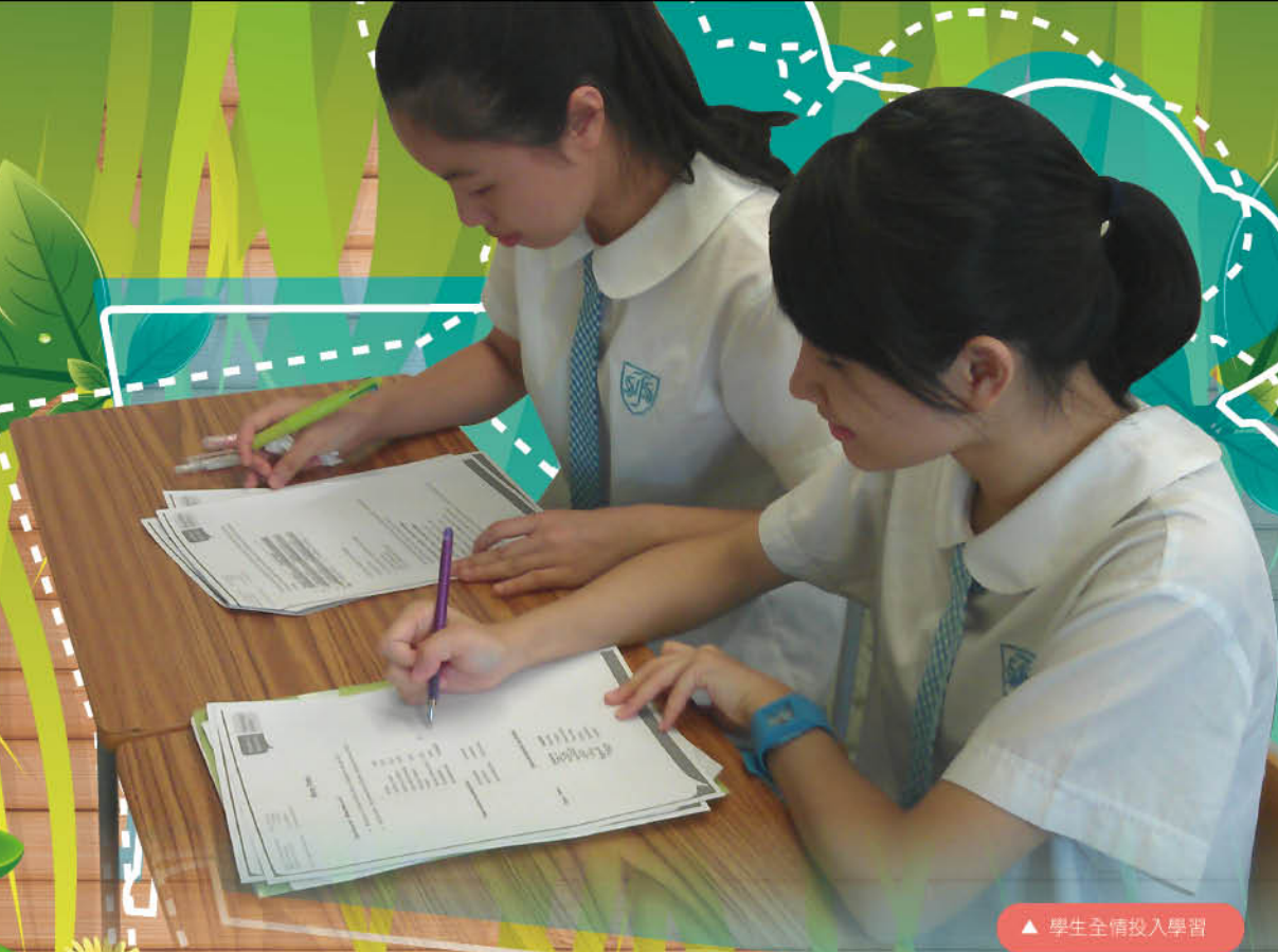
▲ 學生全情投入學習