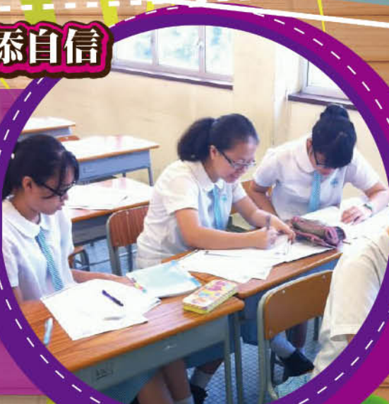
▲ 學生興致勃勃地學習西班牙語

本校課後學習小組於去年度與西班牙語專業學校 Modern Spanish 合辦了為期十五小時的西班牙語到校基礎課程，學生反應熱烈。為提升在課堂上的學習效能，學生人數的上限為二十人。西班牙語為世界上第三大語言，特別是在拉丁美洲這個新興經濟體系，西班牙語更是主要語言。故此，學會西班牙語對於學生將來的發展甚有裨益。學生在課堂中除了學習西班牙語的基礎文法及詞語外，亦學會一些簡單的日常用語。導師除直接教授西班牙語外，更會鼓勵學生多在課堂上以西班牙語對話。學生在課堂上十分投入，學習氣氛良好。上了十五節的西班牙語課後，大部分學生已能掌握基本會話。相信在此基礎之上，學生日後深造西班牙語或學習其他外語會信心大增，事半功倍。