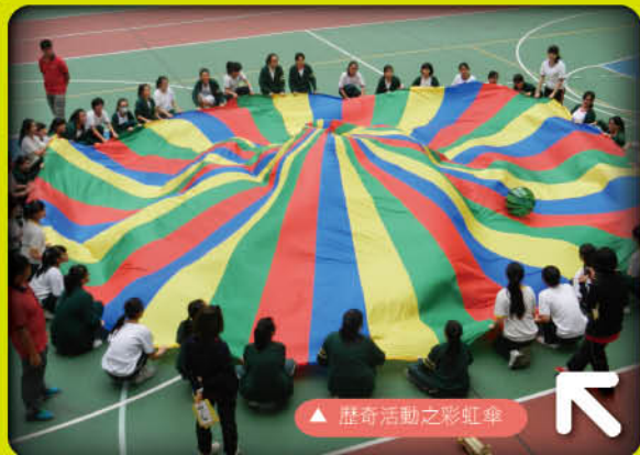
▲ 歷奇活動之彩虹傘