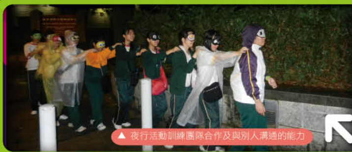
▲ 夜行活動訓練團隊合作及與別人溝通的能力