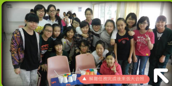
▲ 解難任務完成後來張大合照