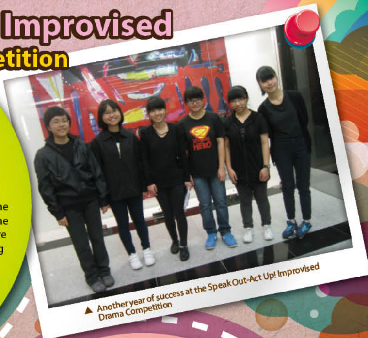
▲ Another year of success at the Speak Out-Act Up! Improvised Drama Competition

The team won two prizes: a team prize for Dramatic Technique and an individual prize for Best Use of English .