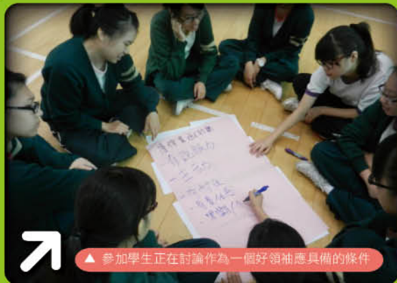
▲ 參加學生正在討論作為一個好領袖應具備的條件