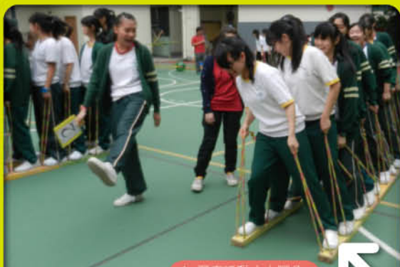
▲ 歷奇活動之大腳八