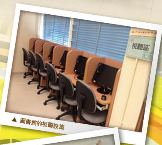
▲ 圖書館的視聽設施

為提升學生的閱讀興趣和自學能力，圖書館推行了多元化的閱讀活動和比賽。首先有舉辦了多年的「誰是圖書館的好朋友」閱讀獎勵計劃，還有與家教會合辦的「親子閱讀比賽」，希望將閱讀的氣氛延續到家中，並促進親子關係。此外，每年不同科種的書展吸引大量的學生和家長參觀、選購。去年，圖書館和通識科曾帶領中一學生參觀九龍中央圖書館，並學習搜尋網上不同的資源。加上本校圖書館經翻新後，添置了不少的電腦設備和多媒體學習軟件，這些都有助學生提升自學能力。