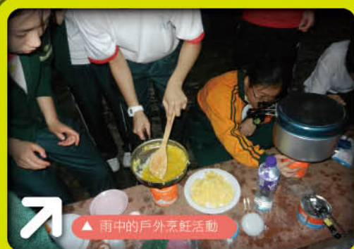
▲ 雨中的戶外烹飪活動