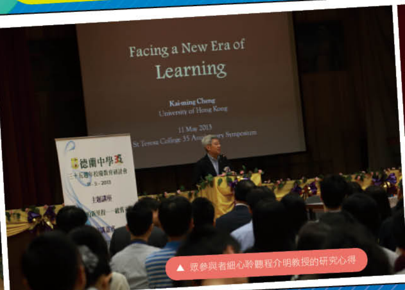
▲ 眾參與者細心聆聽程介明教授的研究心得