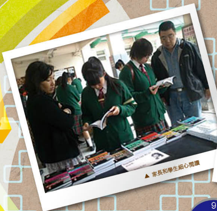
▲ 家長和學生細心閱讀