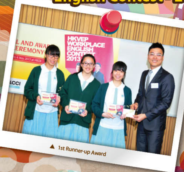
▲ 1st Runner-up Award

1st runner-up, Strongest Language Skills (individual prize) and the Employer's Most Favourite Video .